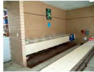
Imagen de las tarjas del comedor antes de la remodelación.

Elaboración de muebles tipo closet de madera con recubrimiento de material tipo formaica.