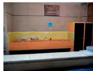
Imagen de las tarjas del comedor después de la remodelación.

Actualmente el 90% del alumbrado del Internado, cuenta con ahorrador de energía.