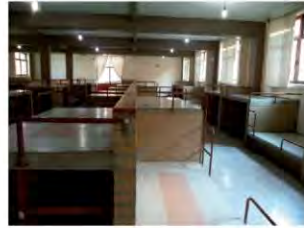
Imagen de dormitorios de la sección chicos antes de la remodelación.

Mantenimiento, Infraestructura y áreas generales.