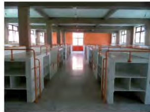
Imagen de dormitorios de la sección chicos después de la remodelación.